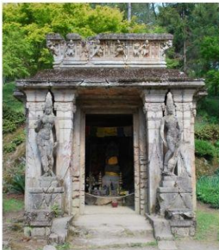
Le Temple et l'escalier aux Lions