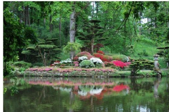
La Butte aux Azalées