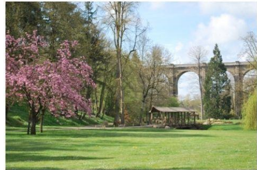
Ile du Soleil couchant, pont couvert