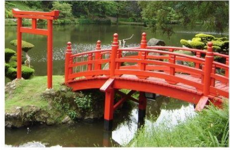
Le pont Rouge et les îles du Paradis